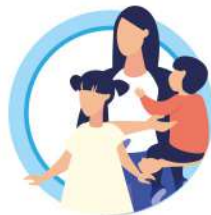
У ДЕТЕЙ ДО 5 ЛЕТ