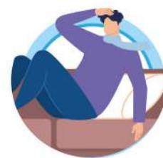
У ЛИЦ С ОСЛАБЛЕННОЙ ИММУННОЙ СИСТЕМОЙ