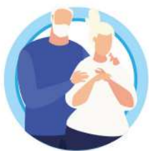
У ПОЖИЛЫХ ЛЮДЕЙ СТАРШЕ 65 ЛЕТ

РИСК ТЯЖЕЛОГО ТЕЧЕНИЯ ГРИППА И ОРВИ ЗНАЧИТЕЛЬНО ВЫШЕ: