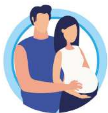
У БЕРЕМЕННЫХ ЖЕНЩИН