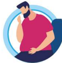
У ЛИЦ, ИМЕЮЩИХ ХРОНИЧЕСКИЕ ЗАБОЛЕВАНИЯ